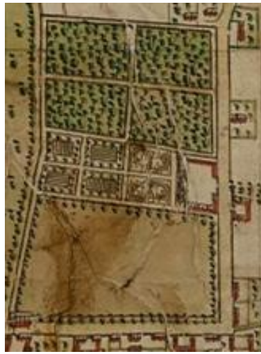
Plan de la plaine du Lys et de ses environs par Jean Breteuil – 1718 – AD60 : plan 1209