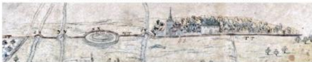
Plan de la Morlaye et des environs (extraits) daté entre 1502 et 1520