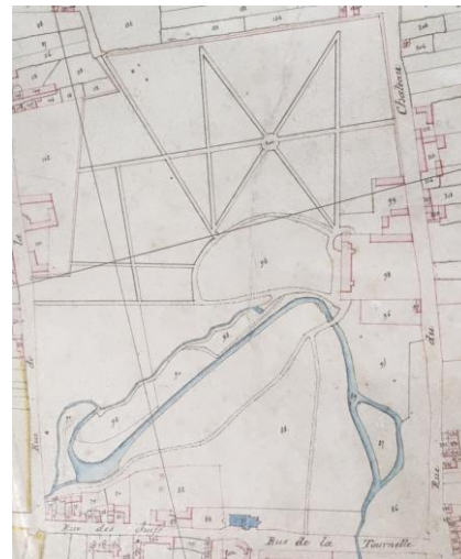
Atlas cadastral de Lamorlaye dit « Napoléon » - 1810 – Archives municipales de Lamorlaye : 1G3

1786 : le jardin à la française est entouré des deux côtés par des bois traversés d'allées régulières ; depuis 1762, la route Royale traverse Lamorlaye ; elle est tracée et bordée d'arbres ; le chemin de Paris à Clermont existe encore le long du parc mais on a planté des arbres dans le terrain qui le borde à l'ouest.