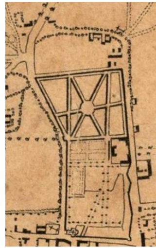
Carte de la forest de Chantilly, où sont marquées les nouvelles routes, carrefours et chemins faits pour la commodité des chasses par Nicolas Delavigne – 1744 – Bibliothèque du musée Condé : CP_C_0086

1718 : les futaies ont gagné du terrain, le jardin à la française devant le château est légèrement modifié.